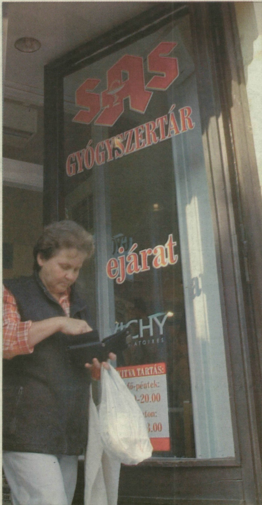
A gyógyszerészek 12–26 százalékos árrést alkalmaznak a 3500 forintnál olcsóbb szereknél