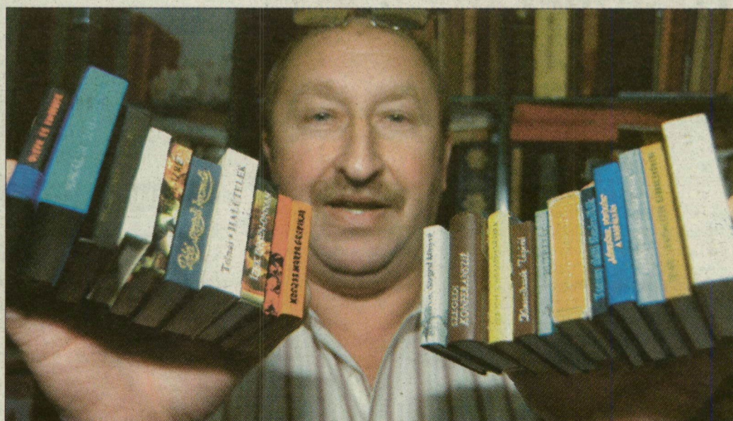
A legkisebb szakácskönyvek két kezben is elférnek