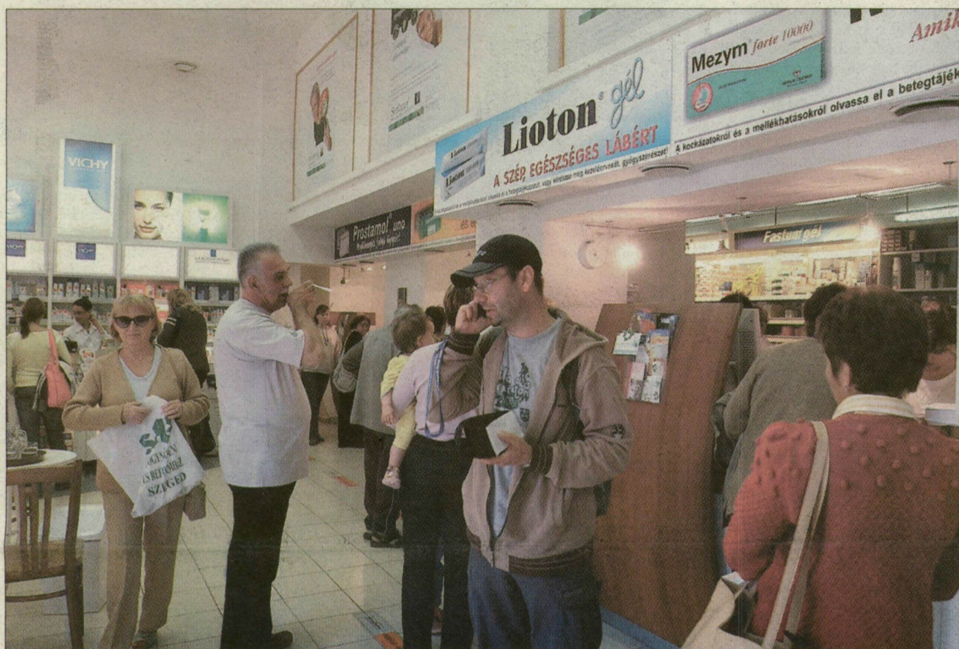
Forgalmas helyen van az Anna-kúti Sas patika