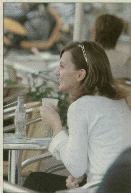
Október közepén is kedveltek a kiülős helyek a Kárász utcán

Hiába hűvösebb az idő, a teraszok többsége kitart, hiszen bevételük jelentős részét az utcai fel- szolgálás teszi ki. Az A Cappellában az emeleti részén egyet-