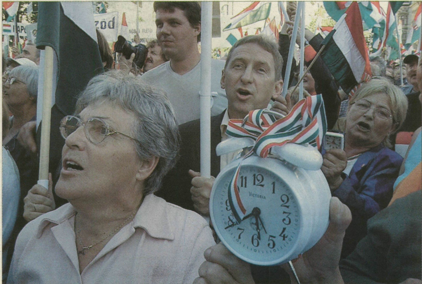
A szegediek is vekkerrel tüntettek a Kossuth téren