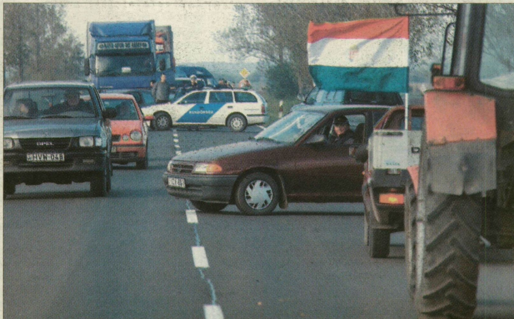
A piros-fehér-zöld lobogókkal feldíszített járművek lelassították a 43-as forgalmát

– Reggel fél 6-kor már úton voltunk, hiszen a megye minden szegletéből jelezték részvételi szándékukat a gazdatársaink, és össze kellett várnunk egymást. Összesen harminc traktorral és ötven autóval vonultunk fel, úgy, hogy húsz Csongrád me-