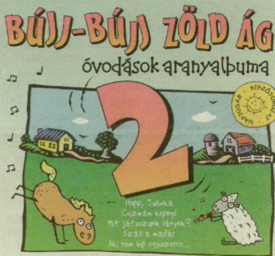
A dalok szövegei megtalálhatók a borító belsőjében!