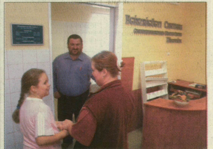
Megindult az új orvosi rendelőben

A beruházás a második ütemmel folytatódik, jelenleg a tervezésnél tartanak. Az önkormányzat az idők napközi otthonát, vagyis a szociális centrumot építi föl. A beruházás ezen részéhez pályázat útján próbálnak támogatáshoz jutni.