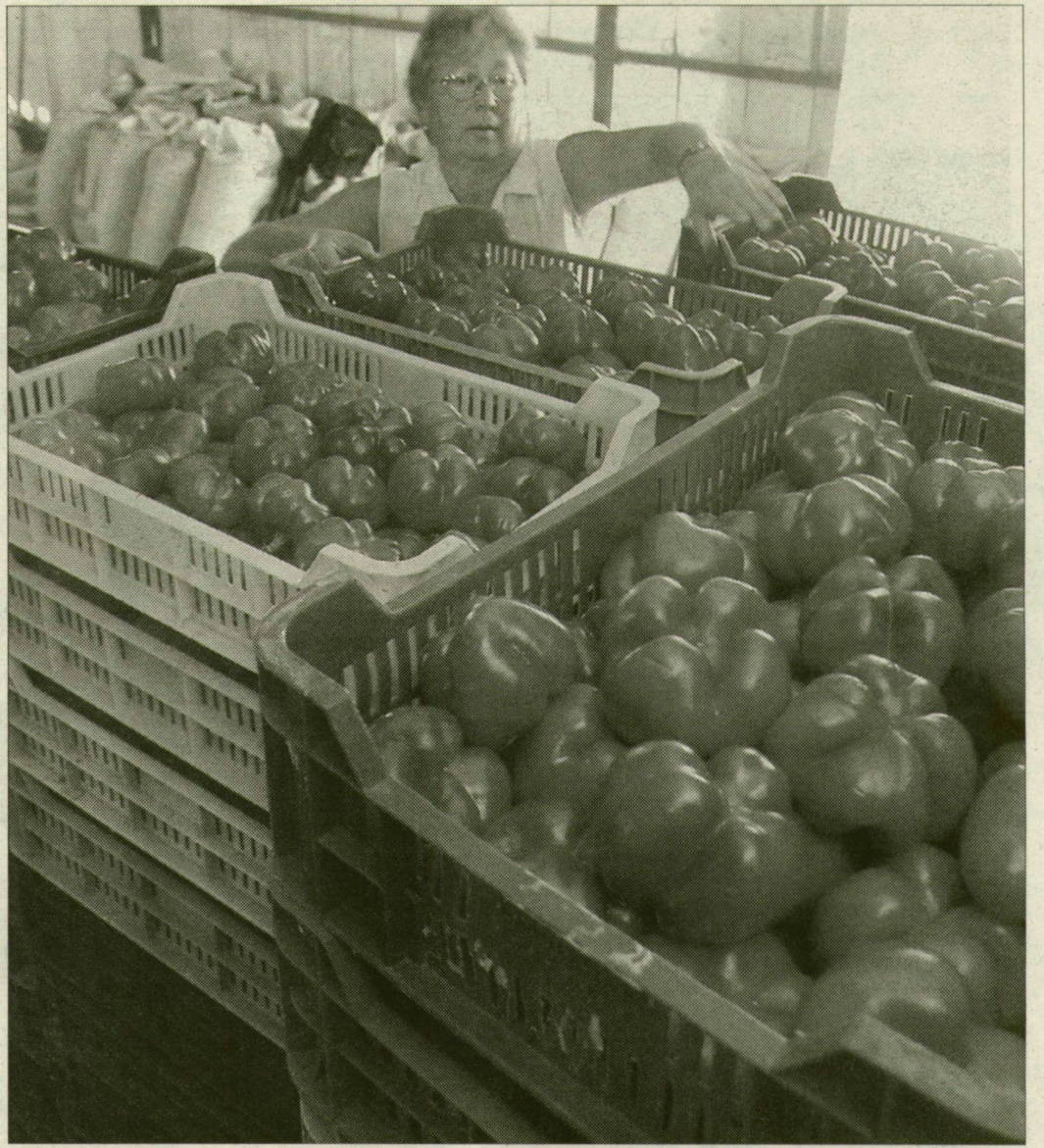
Nem tudni, meddig működik a pritamínpaprika-felvásárlás Mindszenten