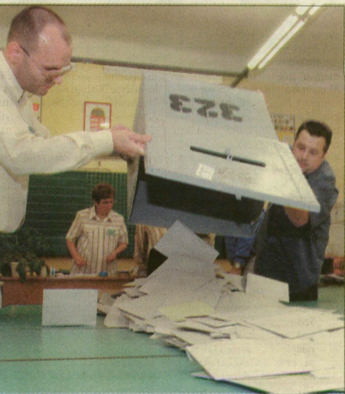
Este hét óra után kezdték számolni a voksokat

Természetesen mindez nem jelent alkotmányjogi értelemben népszavazást. De a nép szavazott. Egyértelműen.