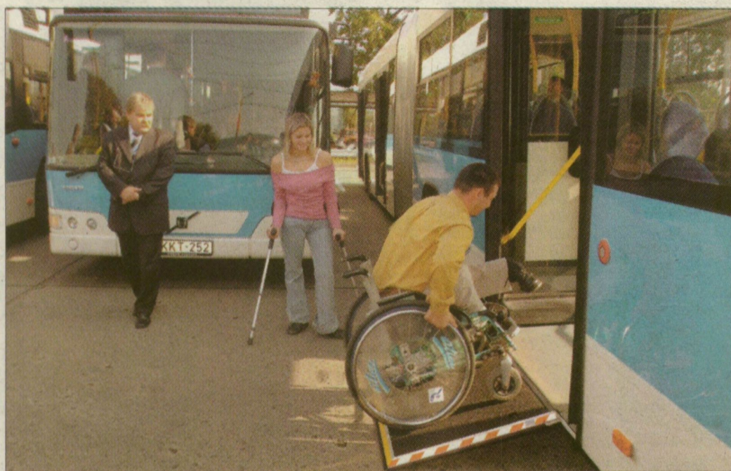
A mozgáskorlátozottak is küzdenek az adóforintokért

A civil szervezetek közül az egészségügyi, szociális és állatvédő alapítványok, egyesületek – és a történelmi egyházak – kapják a legtöbb felajánlást. Főleg azok a szervezetek, amelyek intézményeket is fenntartanak, azáltal ugyanis nagyobb az ismertségük, több család, azok rokonsága, baráti köre kötődik hozzájuk. Jó