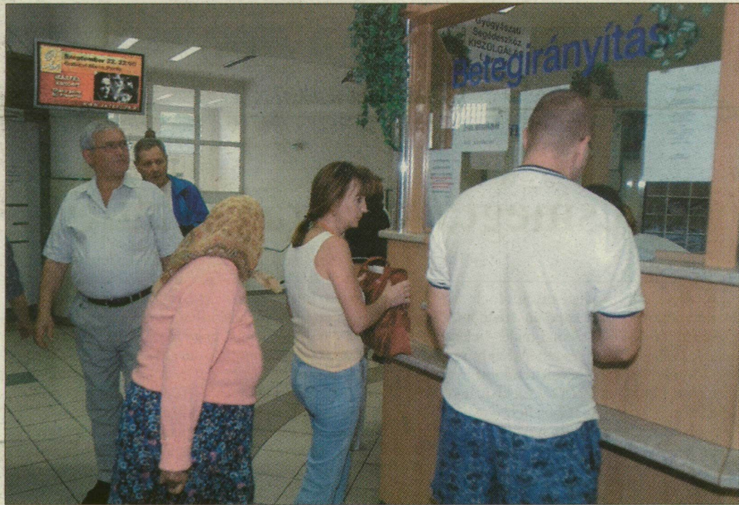
A várólisták bevezetése is feltétele volt annak, hogy az intézmény talpon maradjon.

Havi 20 millió forintnyi plusz-adósság helyett havi 25 millió forint nyereség – ennyit változott egy év leforgása alatt a szegedi rendelőintézet gazdálkodása. A tavaly ősszel kinevezett főigazgató úgy számolja, jövő év közepére ledolgozzák a teljes, több mint félmilliárdos adósságot.