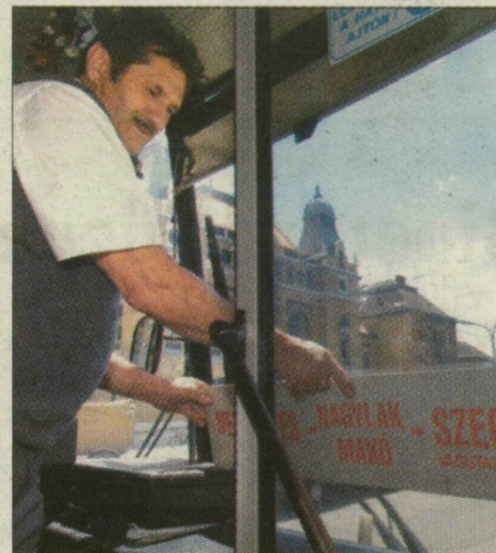
Vagy a busz, vagy a vonat. Másfél év múlva csak az egyiket támogatják.

ahol óránként megy vonat a fővárosba. Írásunk a 7. oldalon.