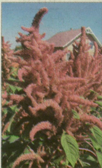
Amaránt. A belőle készült ételeket lisztérzékenyek is fogyaszthatják

Megkezdődött az amaránt aratása a szegedi gabonakutató kht.-nál és a vele kapcsolatban álló termelőknél. A szélsőségesen száraz, forró klímát is tűrő élelmiszernövény nagy jelentőségre tehet szert a jövőben, ha tovább folytatódik a globális klímaváltozás. Lisztérzékenyeknek kitűnő, s mindenki számára egészséges. Az amaránt élelmiszer-alapanyagként máris beszerezhető szegedi bioboltokban.