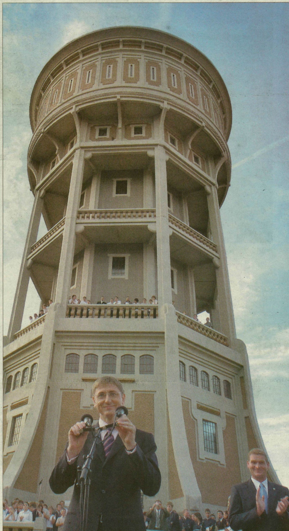
Gyurcsány Ferenc és Botka László az Óreg hölgy alatt