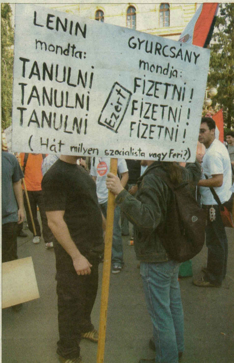
A táblákkal tüntetőket – a politikamentesség nevében – a tömeg szélére kísérték a biztonsági emberek

1995-ben az akkori kormány a Bokros-csomag részeként tandíj kivánt bevezetni a felsőoktatásban. A diákok akkor sem értették egyet az ötlettel, ezért tavasszal a Pénzügyminisztérium elé vonultak, októberben pedig többnapos megmozdulást tartottak a Parlament előtt. Október 5-én több tízezer tüntetett a Kossuth téren. Aznap a hallgatók és Horn Gyula miniszterelnök megállapodtak arról: kétezzer forint lesz a tandíj, de az előzetes tervekkel ellentétben kiegészítő tandíjat nem vezetnek be. Az országos tüntetés előtt egy nappal Szegeden is demonstráltak a hallgatók és az oktatók. A Dugonics téri megmozdulásra akkor így invitáltak a plakátok: „Ne ülj a fenekeden!” 1998-ban a Fidesz, kormányra kerülésekor eltörölte a tandíjat.