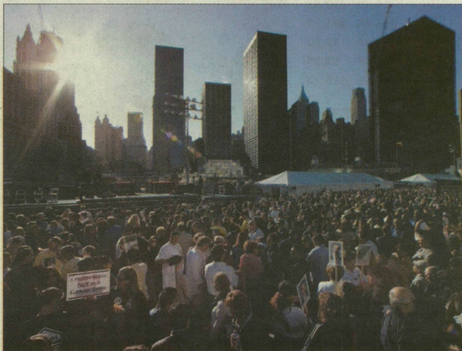
A felkelő nap fényénél több ezren emlékeztek tegnap a 2001. szeptember 11-i repülőgépes terrortámadásokra a New York-i Világkereskedelmi Központ helyén.

6724 SZEGED, VÁSÁRHELYI PÁL U. 18. • TEL.: 62/551-800