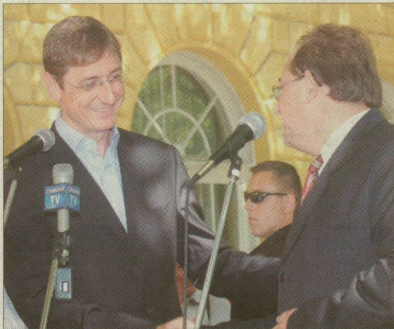
Sípót fújnak Csongrádon, miközben Gyurcsány Ferenc Bedő Tamás polgármester mellett kampányol