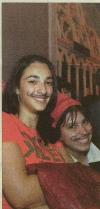
Sok lány is bajuszt festett magának