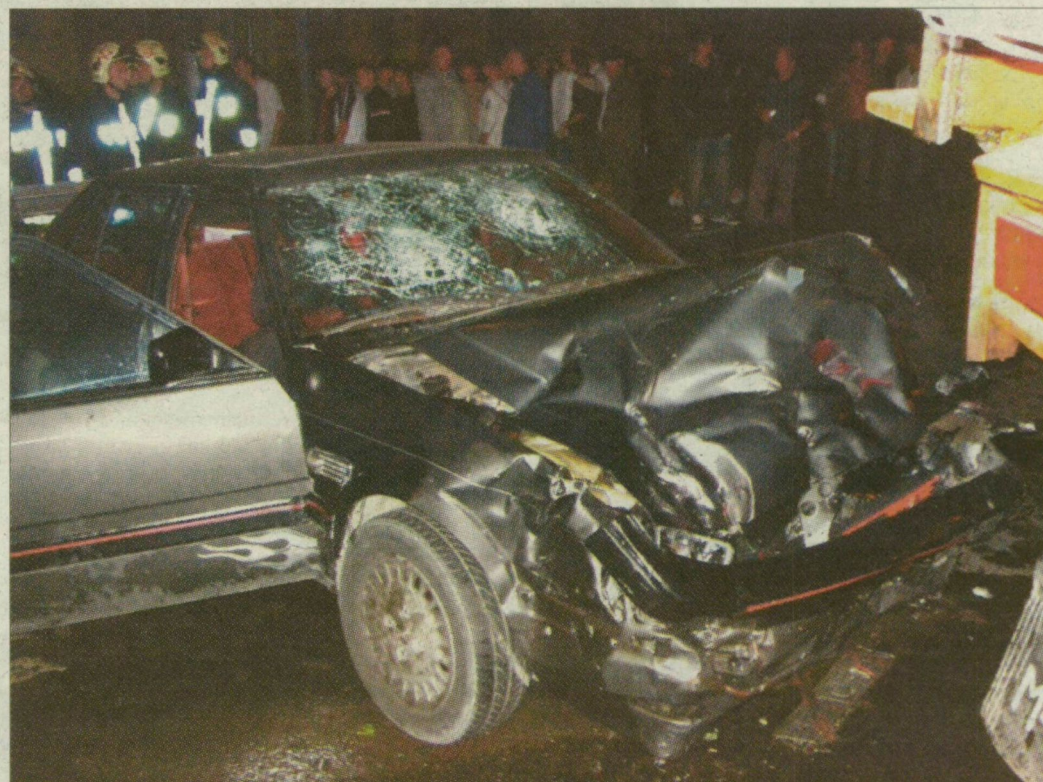
Úttisztító gépkocsi ütközött Szegednél egy Mazda, négyen súlyosan megsérültek