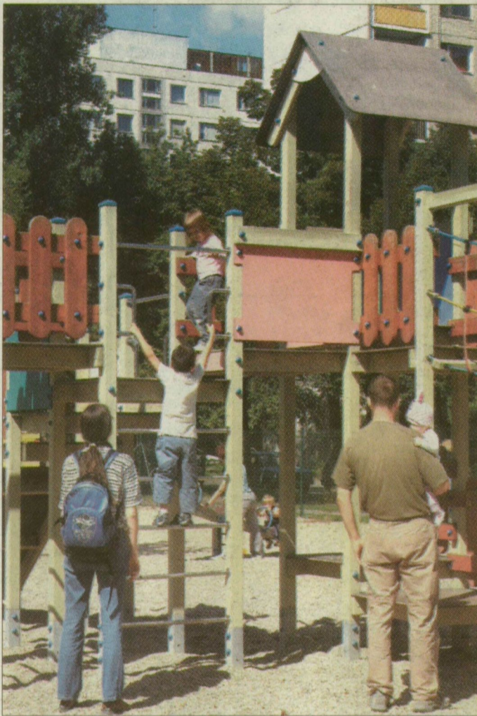
Mászóvár a panelházak árnyékában

Mindezekért a Máltai Játszóház soha nem kért pénzt. A pedagógusok bérét, a rezsit, az éjjel-nappali őrzést – mely a városi játszótérek között szintén egyedinek számít – az önkormányzat, valamint a Szociális és Családügyi Minisztérium fele-fele arányban fizette. Utóbbi forrás azonban három évvel ezelőtt elapadt, akkor a szeretetszolgálat