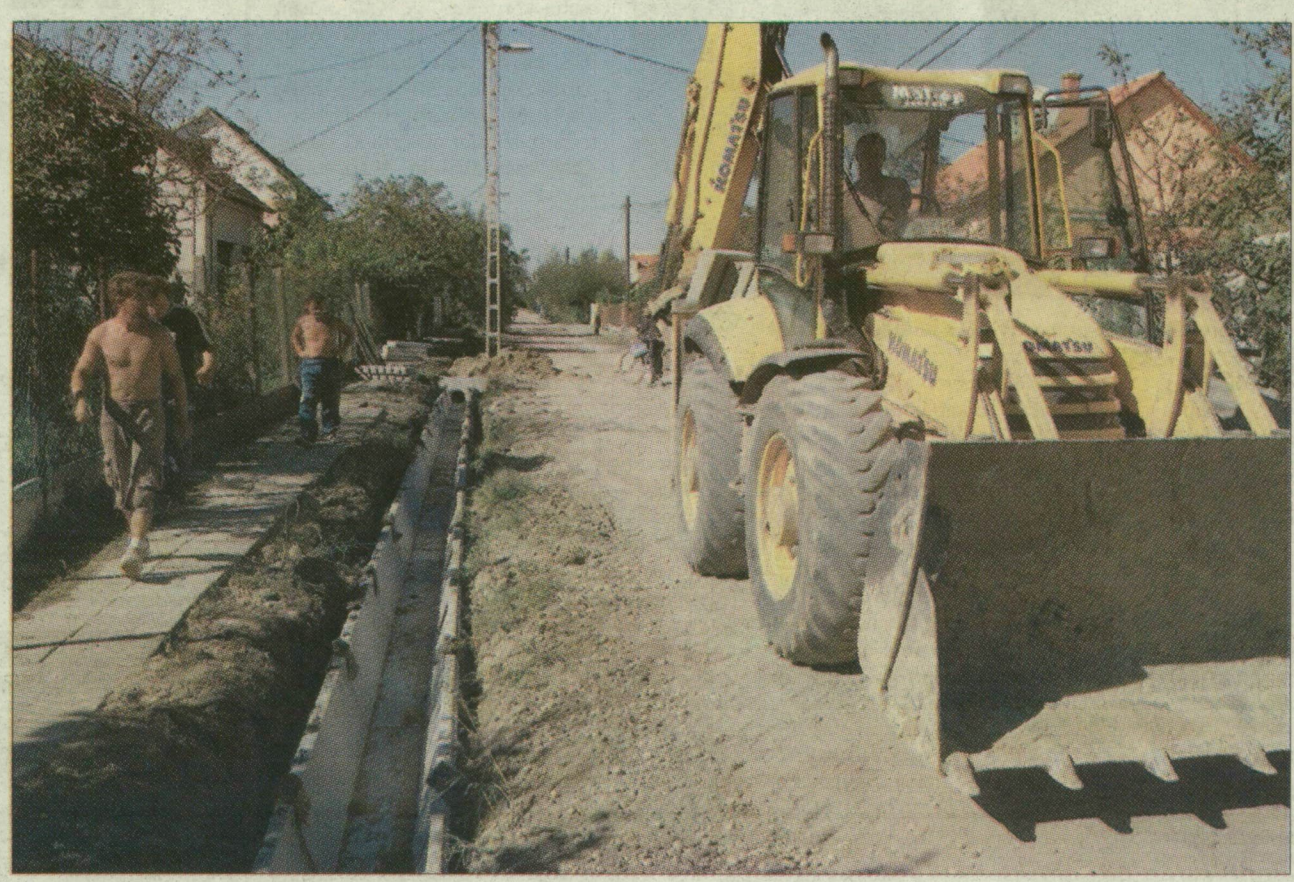
Baktón gőzerővel dolgoznak a csatornaépítők. A Tölgyfa utcában itt tartanak