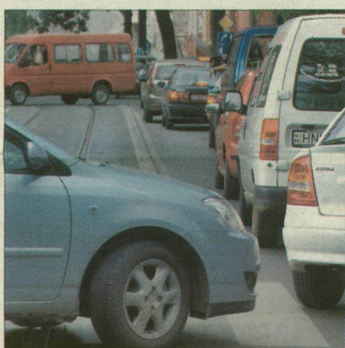
Türelmijáték a Tisza Lajos körúton