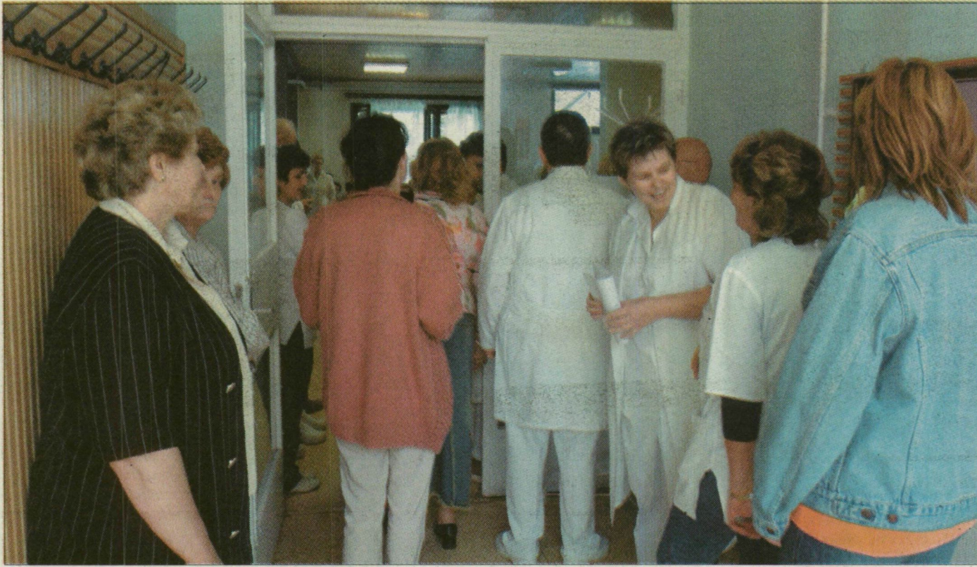
Húsba vágó információkat kaptak a kórházi dolgozók