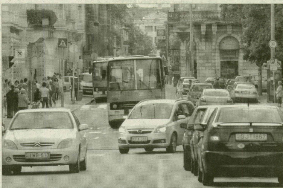
Alig férnek az autók és a buszok a hídfeljáró és a Tisza Lajos körút között.