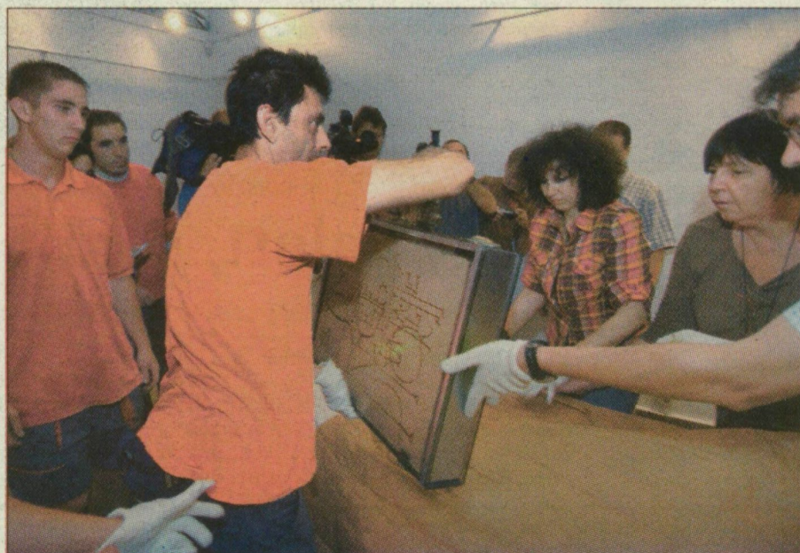
Kesztyűs kezek között az egyik értékes műtárgy