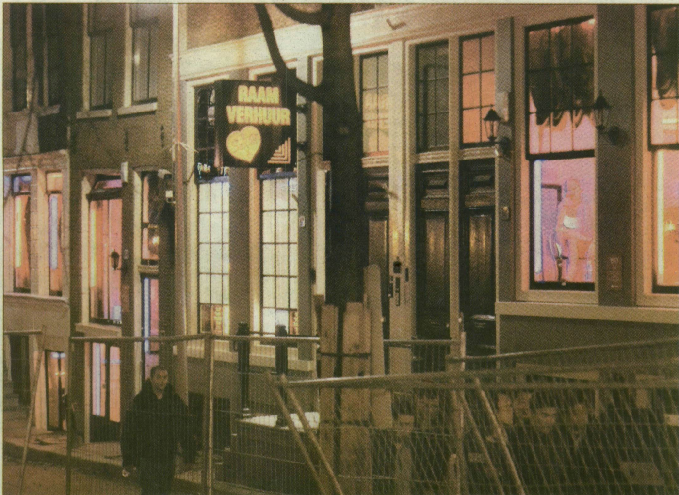
A vigalmi negyed egyik jellegzetes, „kirakatos” utcája Amszterdamban

A nemi betegségek megelőzésére a 14. században Európa pár nagyvárosában a „céhszerű” szabályozás megalkotása mellett már kötelezővé tették a prostituáltak orvosi vizsgálatát – ami a későbbi