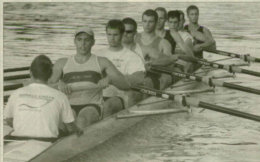
Trakaiban nyolcadik lett az SZTE-sek alkotta magyar nyolcas