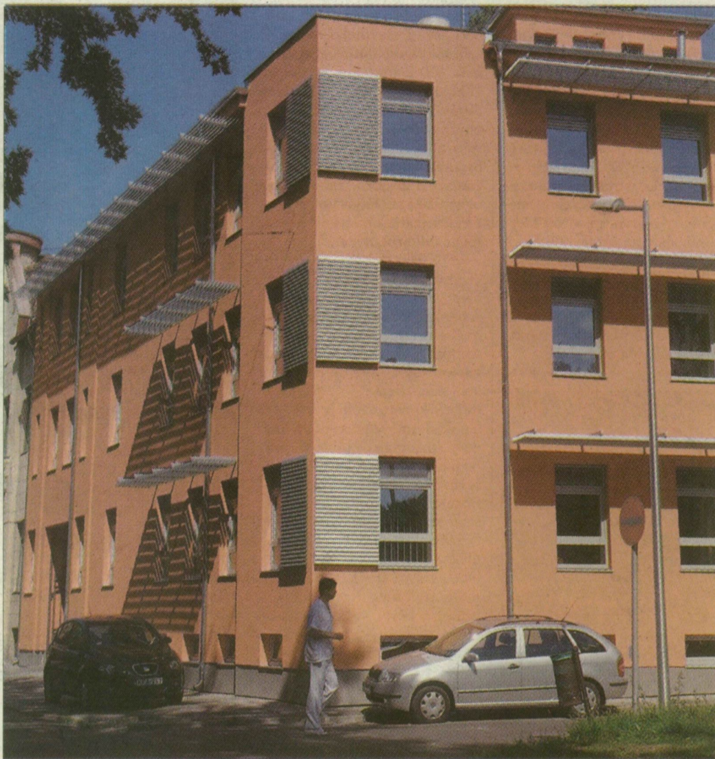
Tudásközpont Szegeden. Már áll az első épület a klinikakertben

A szimpatikus célokot főlávzó anyag általánosan fogalmaz. Készítői megállapítják, hogy a déli régiók átalakulásra szorulnak, mert fejlődési ütemük elmarad a többi régióétól. Kimondják: Szegeden jelentős tudásközpont található, de ennek lehetőségeit a dél-alföldi régió nem tudja kiaknázni, mert még nem történt meg az ipari szerkezetváltás. A gyenge versenyképességű gazdasági szerkezet itt alacsony képzettségű munkaerővel párosul. A dokumentum növekedési lehetőségként említi a helyi adottságokra épülő különleges tudást, Szegeden például a paprikafeldolgozást.