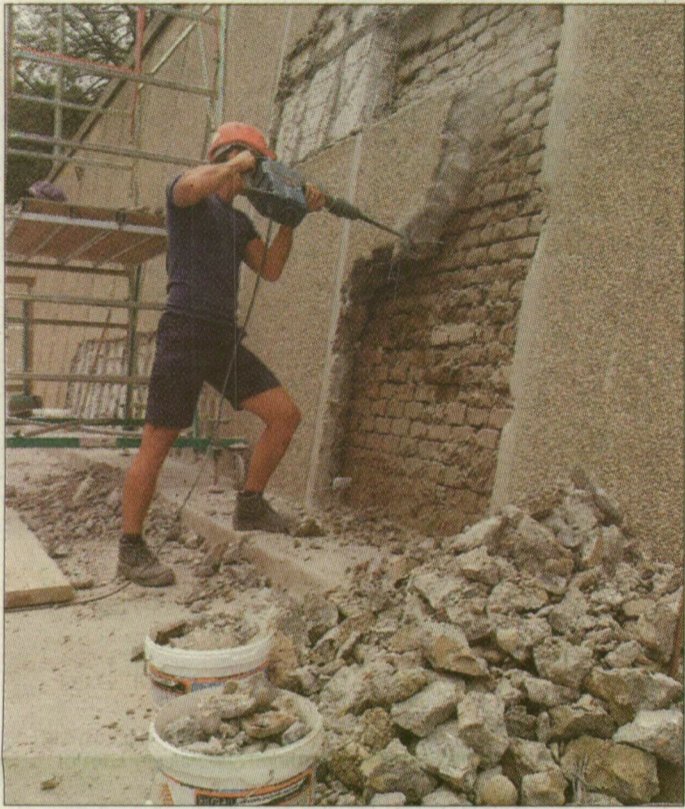
A lebontott vasbeton panelelemek mögül kibukkan az 1897-es, nagy árvíz után készült téglafal