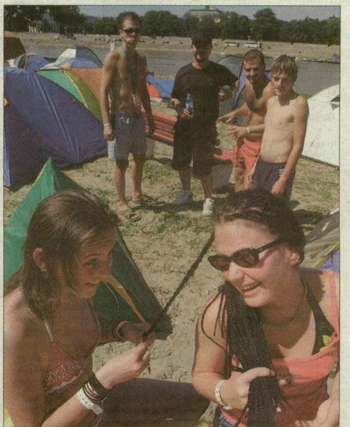
Parti idill: hajfonás drukkerekkel

Állandó orvosi ügyeletet tartanak a SZIN-en: napközben a központi elsősegélynyújtó helyen várják a sérülteket, esténként pedig a nagyszínpad melletti sátorban is. A koncertek alatt járőrszolgálat, valamint a biztonságiakkal és a rendezőkkel kiépített rádiókapcsolat is működik, hogy egy esetleges balesetről a lehető leghamarabb értesüljenek a szakemberek. Mindezeknek köszönhetően néhány perc alatt a Partifürdő bármelyik pontjára eljuthatnak. A rendezvény idején készületben áll egy mentőautó is. Szerencsére erre eddig még soha nem volt szükség: általában csak kisebb sérüléseket és töréseket kell ellátni.