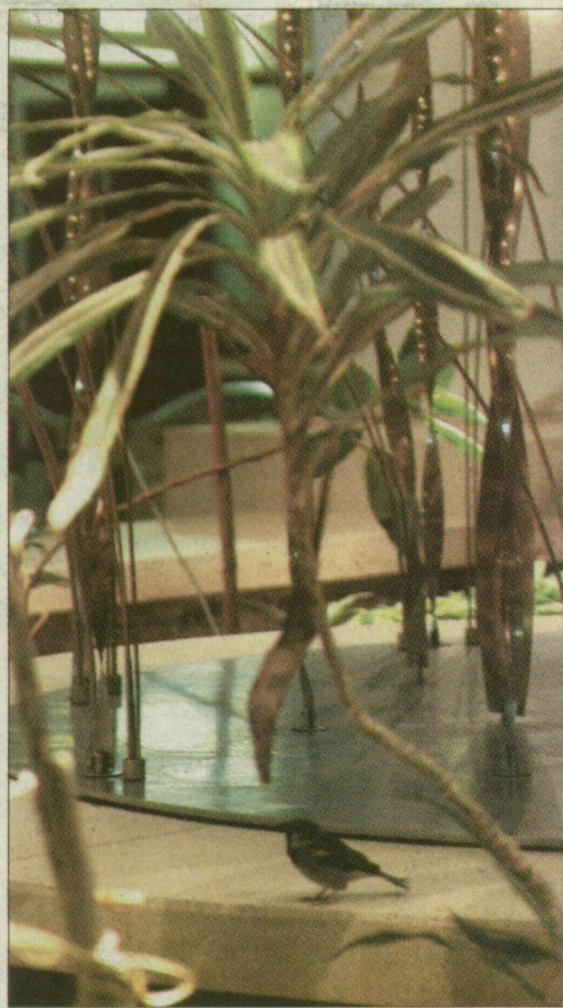
Az új klinika egyik új lakója