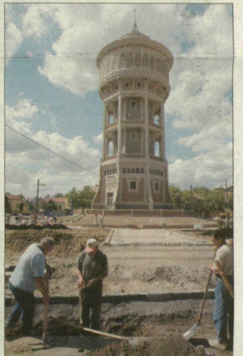
Az Öreg Hölgy már megszépült – a tér is méltó lesz a víztoronyhoz