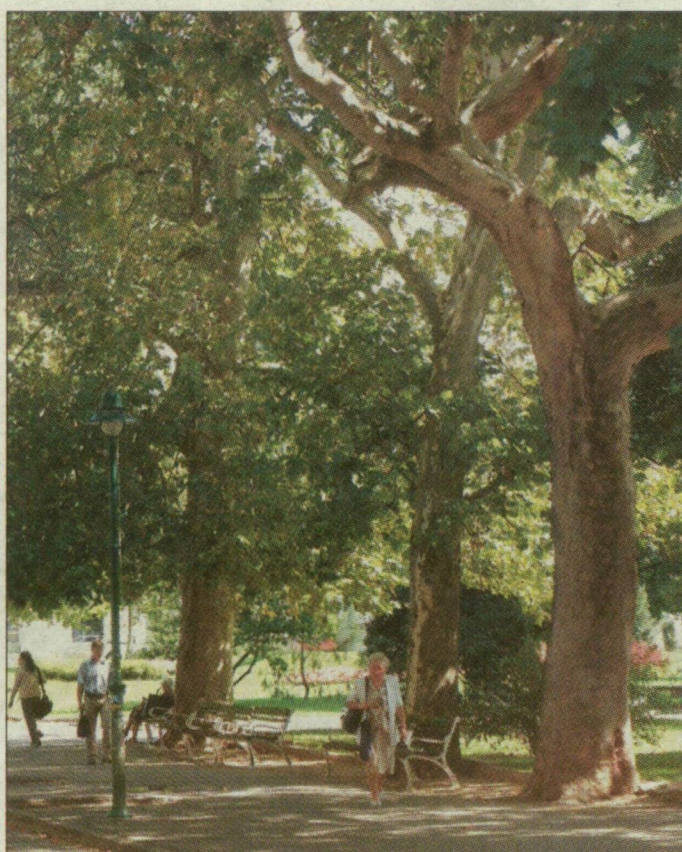
Gyönyörűek, de öregek a Széchenyi téri platánok