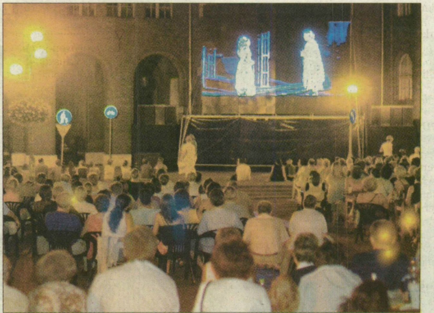
Sokan nézték a Bánk bán díszelőadását az óriásképernyőn

Mozdulni is alig lehetett a szegedi belvárosban tegnap este. A tömeg az Aradi vértanúk terén volt a legsűrűbb, ahol óriásképernyőn követhették a nézők a szabadterén zajló Bánk bán című előadást. Sokan ott-honról hozott széken üldögéltek, mások az Aradi Sörkert pulthoz előtt kigyózó sorban várokoztak. A pultosok nehezen viselték a rohamot. A színpadon és az óriásképernyőn az előadás a Himnusszal kezdődött, majd Hiller István oktatási és kulturális miniszter köszöntötte a nézőket. Beszédében kötelező nyári kulturális eseménynek nevezte a Szegedi Szabadtéri Játékokat. Kijelentette: semmi sem tesz annyira európaivá, mint kultúránk, műveltségünk. Ezután Botka László polgármester virággal üdvözölte Szemes Gézánét, aki már a 75 évvel ezelőtti, első szabadtérinek is nézője volt.