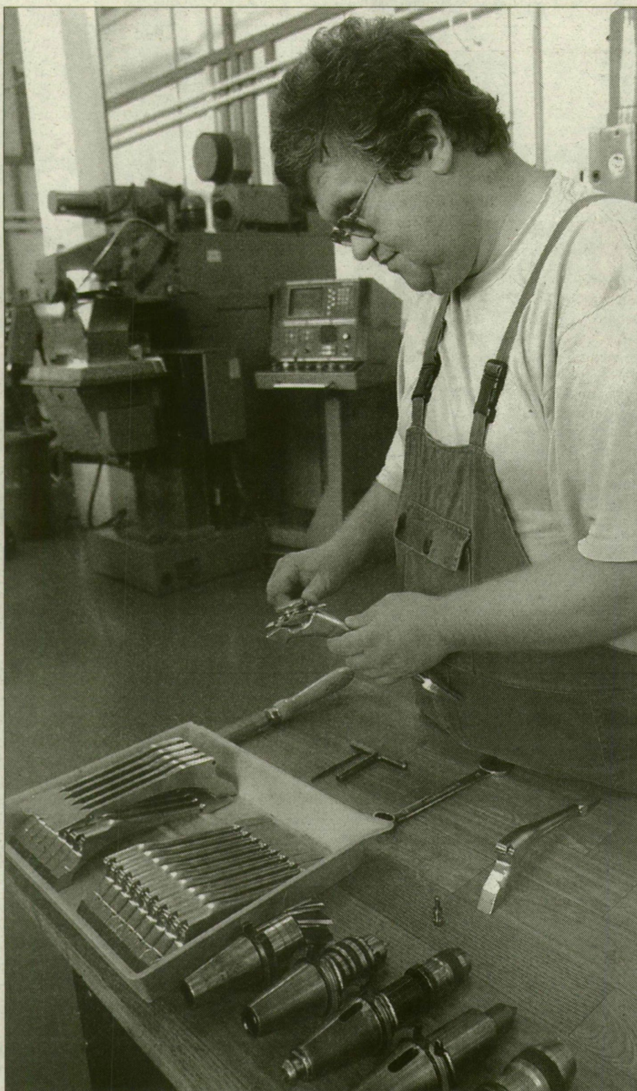
A Protetimmél újfajta implantátumok kifejlesztésén is dolgoznak

A Protetim ma körülbelül négyszázféle, főleg a láb és a kar csontjait pótló implantátumokat készít, de a cégvezető bízik új fejlesztéseikben is, a hosszú élettartamú protézisben, mely a korábbi tizenöt helyett harmincöt évig biztonságosan használható. Sokat várnak a tumor- és az a rotax térdprotézistől, illetve a fogászati implantátum-rend-