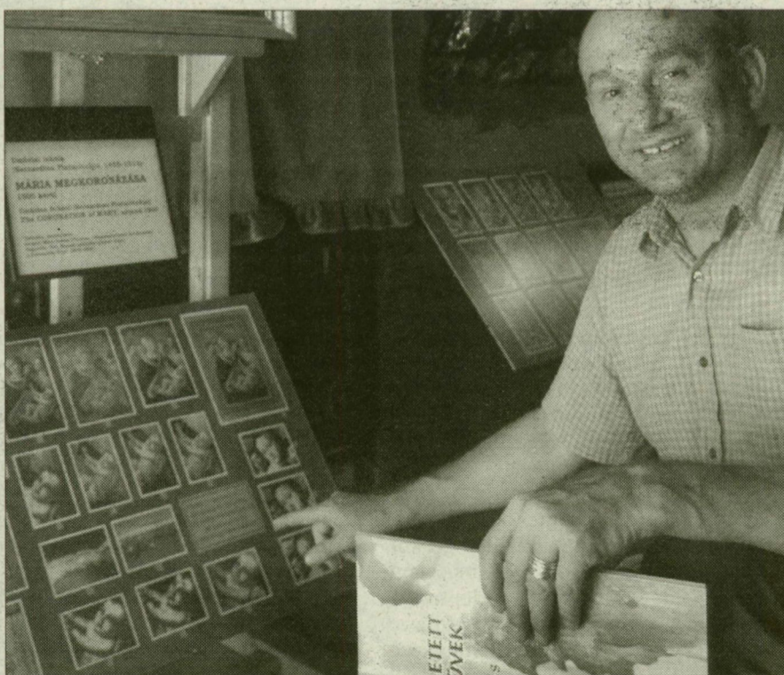
Egy személyben művészet- és helytörténész, vegyész és fizikus is

– A legértékesebb műkincs a legkisebb méretű kép: Rembrandt kortársa festette egy kalpagos férfi-