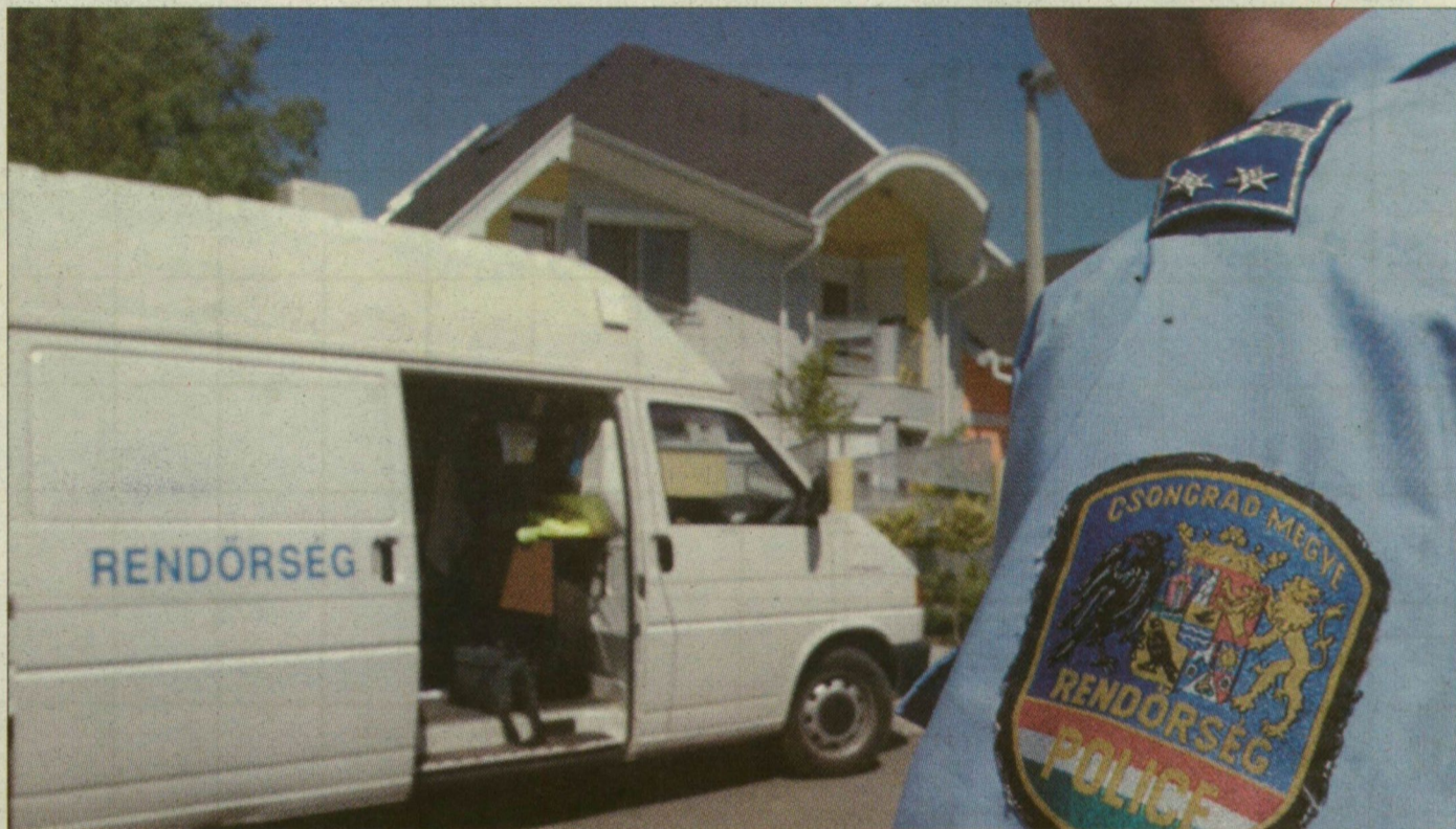
Helyszínelők – tévésorozat helyett: 2000-ben naponta 48, tavaly 43 bűncselekmény jutott a rendőrök tudomására

A legtöbb bűnöző tavaly Miskolcra került ki. Az elmúlt öt évet nagyító alá téve viszont látható: elsősorban Tatabánya és Pécs termeli a tetteseket. 2001 és 2005 között ezer lakosra Tatabányán 18, Pécsen 16 bűnöző jutott – szemben Szegeddel, ahol 12, vagy Hódmezővásárhelyen, ahol 10. Így aztán a kriminálstatisztika segít megdönteni azt az elő-