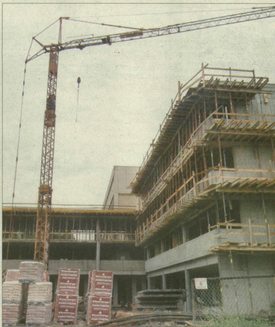
Jól halad az egyetemi építkezés Újszegeden

Sok érv szól emellett, hogy az egyetemi sportközpont területén épüljön föl Szeged új