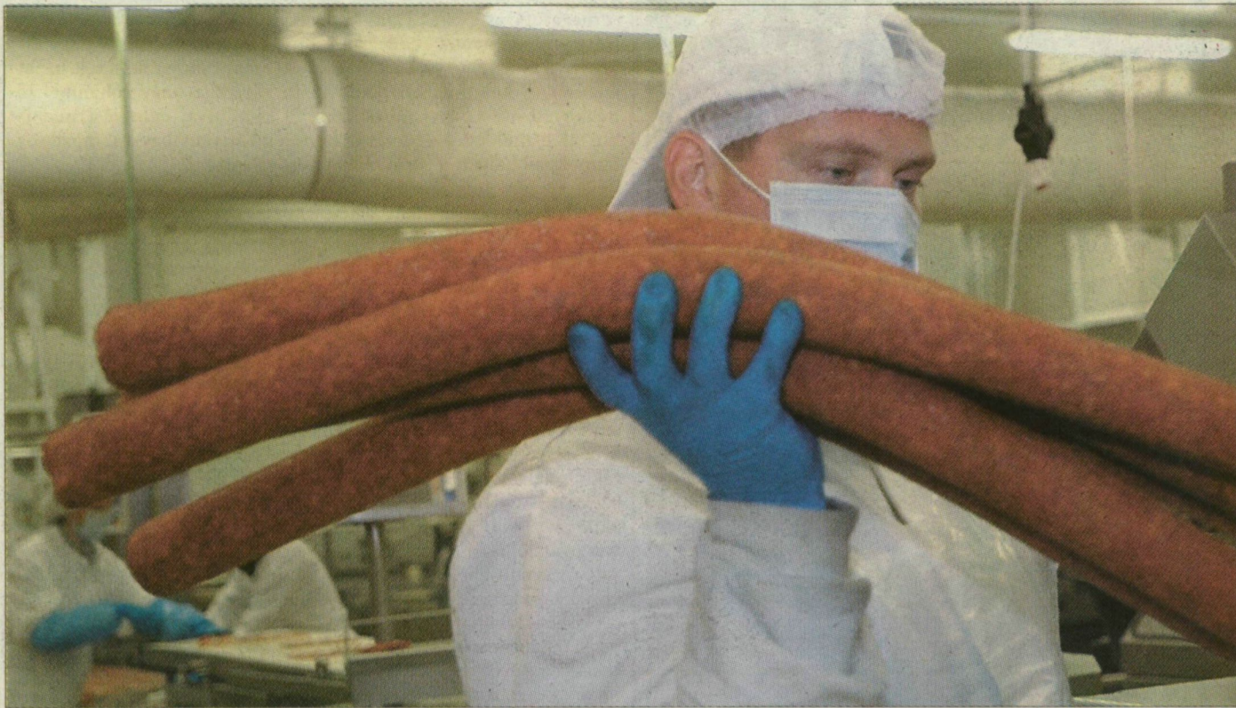
Szeletelésre előkészített szalámirudak a Pick szárazáru-csomagolójában