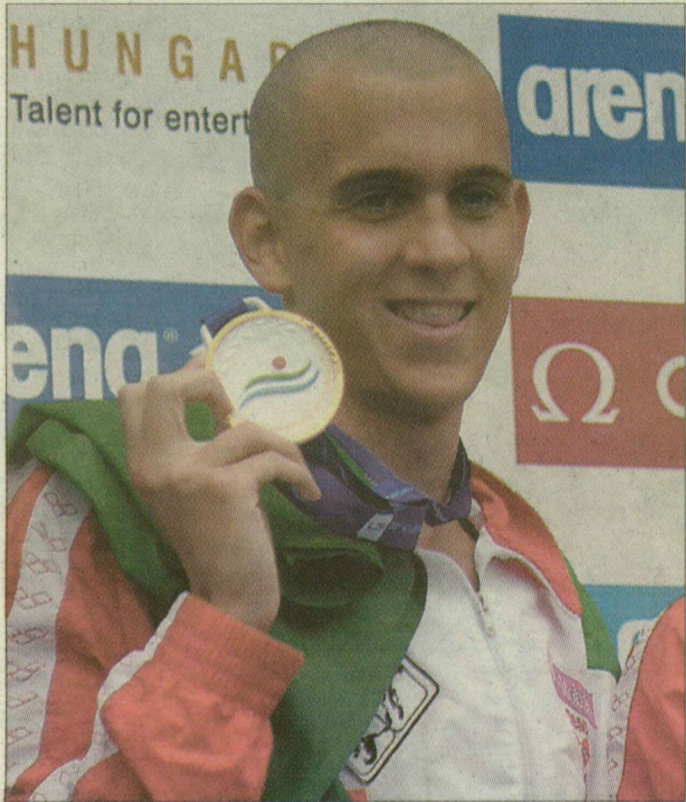
Cseh László és az Eb-arany