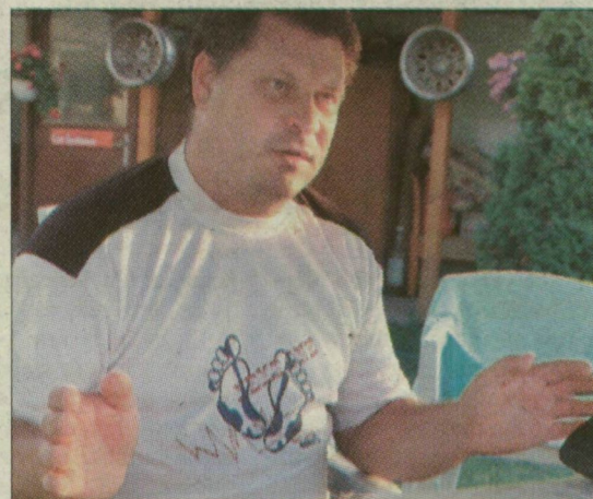
„A tragédia felhívhatja a figyelmet arra, milyen veszélynek vannak kitéve a gyerekek”

Kotroczó Béla méltánytalanságot emleget, és perel