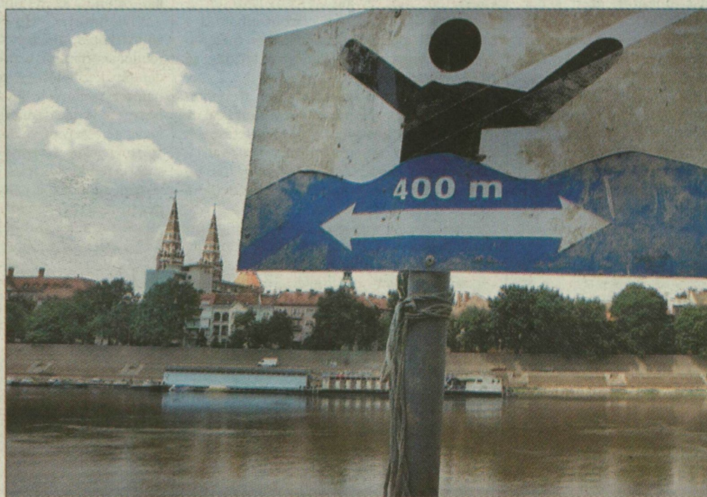
A Laponon nem egyértelmű a fűrdést tiltó tábla sem: a vízben lévő alakot egykor áthúzó piros csíkot valaki régen leszakította

A hétvégi kettős tiszai tragédia tanulsága: az életével játszik, aki tiltott helyen fürdik. A vízi rendőrök sokszor tehetetlenek a szabálytalankodókkal szemben, hiszen nem lehetnek ott egyszerre mindenütt.