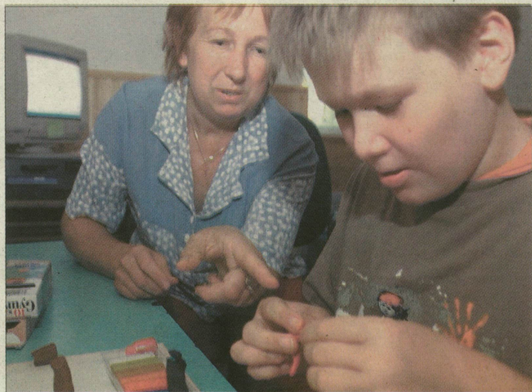
Az autista gyerekekkel szakemberek foglalkoznak, amíg szüleik dolgoznak

Az autistasziget ugyanis jelenleg csupán annyit tud nyújtani, hogy a gyógykezelőket foglalkoztatja a gyerekekkel, amíg a szülők dolgoznak vagy ügyeket