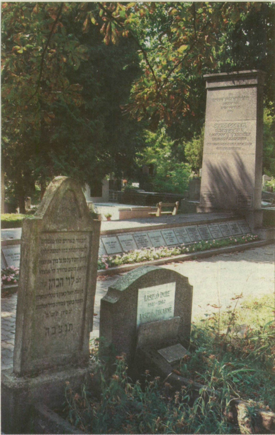
Értékek, emlékek és kövek – a 175 éves temetőben