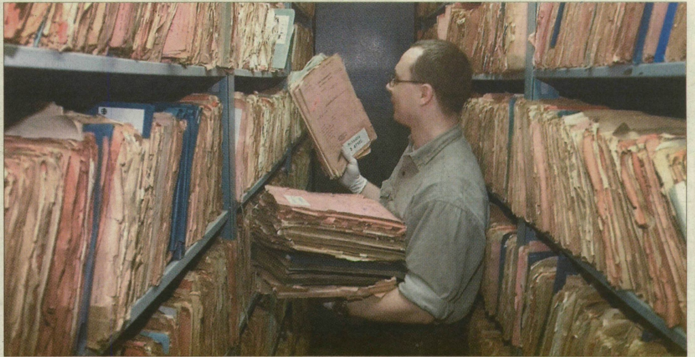
Stasi-irattár Németországban. A volt szocialista államokban szobákat megtöltő dokumentumok szólnak a titkosszolgálatok rendszerváltás előtti tevékenységéről