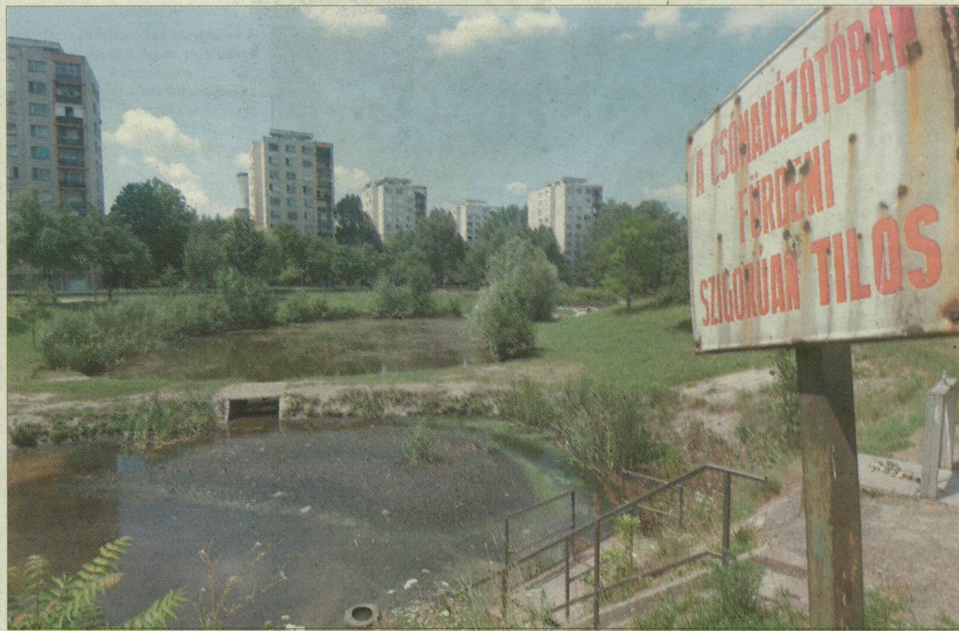
A Záportó és a töltés közé játszótér, műfüves és görkorcsolyapálya készül