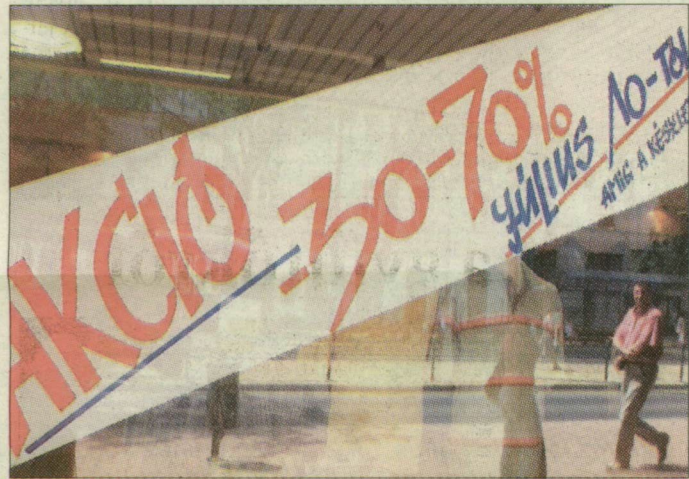
Akár hetven százalékkal olcsóbban is adják