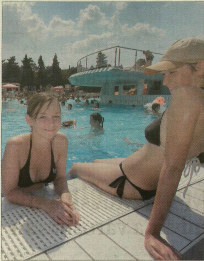
Tegnap még csak nappal fürödtek a vendégek, holnap már éjszaka is

Makót is látni lehetne a magas épületekből, ha nyitva tartanának