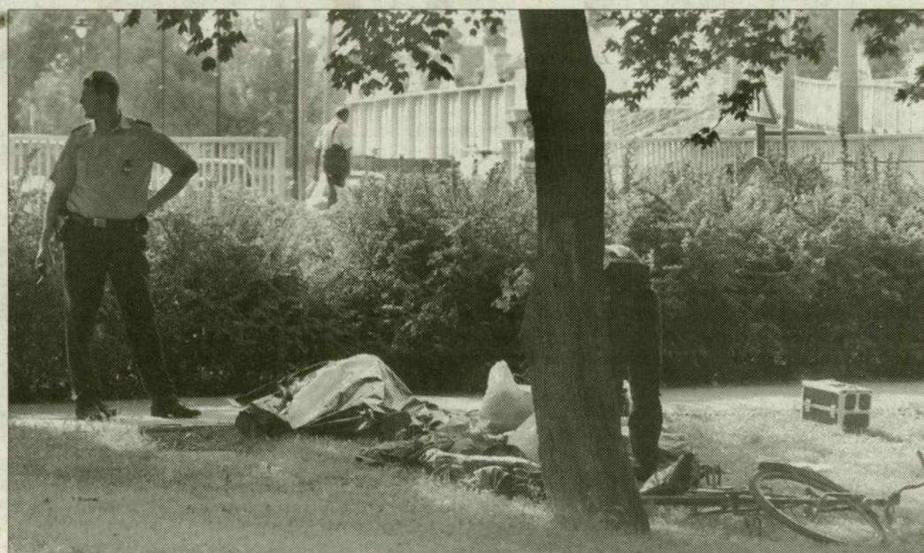
A rendőröknek leltárt kellett készíteniük a hajléktalannál talált holmikról

A mentők hiába vonultak két kocsival is a helyszínre, már nem tudták újraéleszteni a férfit. A halált végül a kierkező orvosi ügyelet állapította meg. A helyszínelő rendőrök a hajléktalant letakarták, és a nála lévő össze-gyűjtött dolgokról tételes leltárt készítettek. A halál okát szakér-tők bevonásával vizsgálják.