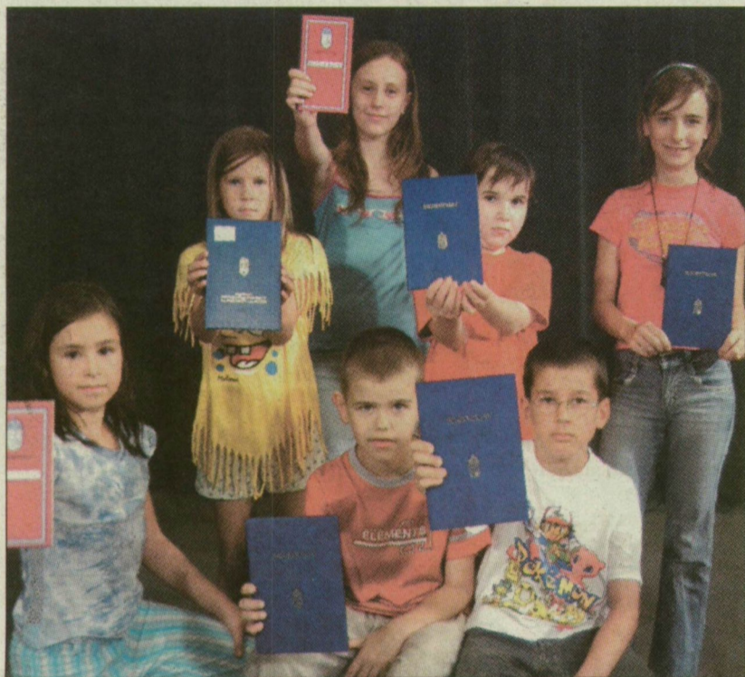
A gyerekek élvezték a fotózást, várják a holnapi sorsolást

Minden eddiginél sikeresebb, harmadik Szín 5-ös játékon 1686 kitűnő tanuló vett részt, közel háromszázal több mint tavaly. A játék értékes nyemrényeit holnap délután sorsoljuk ki, a gyermekek fotóit pedig hamarosan megtalálják majd lapunkban.