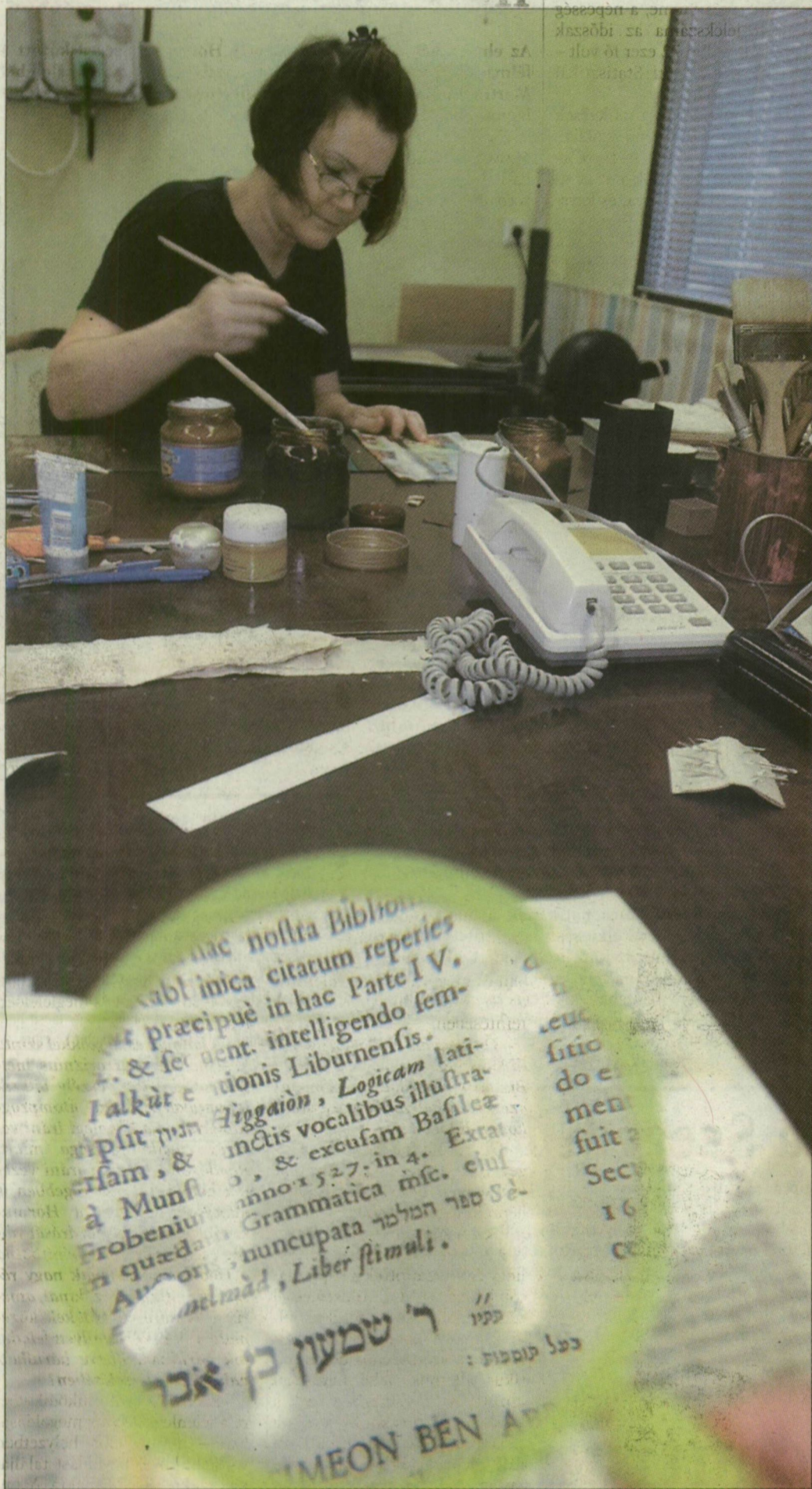
Sikerrel teremtik újra a könyvritkaságokat a Somogyi-könyvtár munkatársai