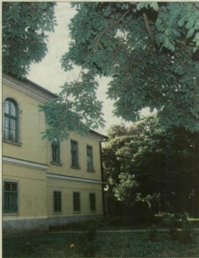
A szegváriak számára fontos közösségi térré vált a patinás kastélyudvar