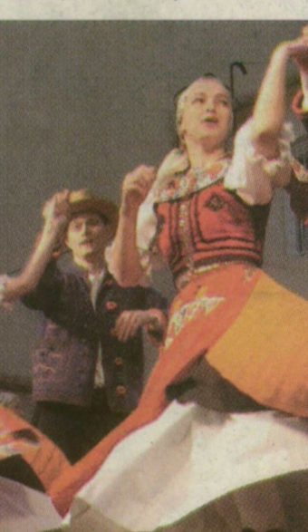
Fellépők a Szeged Táncgyűttes ötvenéves jubileumi programján

vendégszerepel Törökországban, júliusban és augusztusban pedig Német- és Finnországba utazik több szegedi csoportjuk és az együttes táncoktatóitól tanuló határon kívüliek is. A magyar néptáncművelés képviselői a szegedi – illetve az általuk tanított bánsági – táncosok július elején a kétnapos rangos temesvári nemzetközi folklórfesztiválon is, ahol ezernyolcszáz fellépő mutatja be saját népeinek táncait.