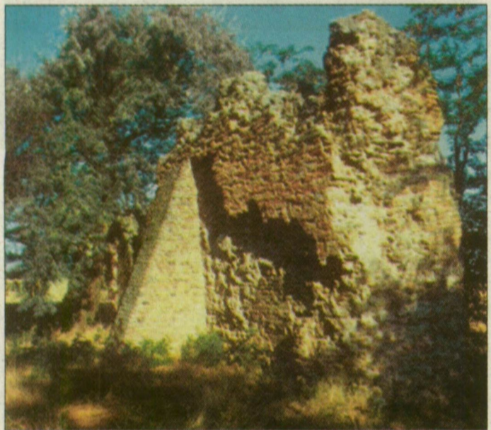
A templomrom vadregényes környezetben