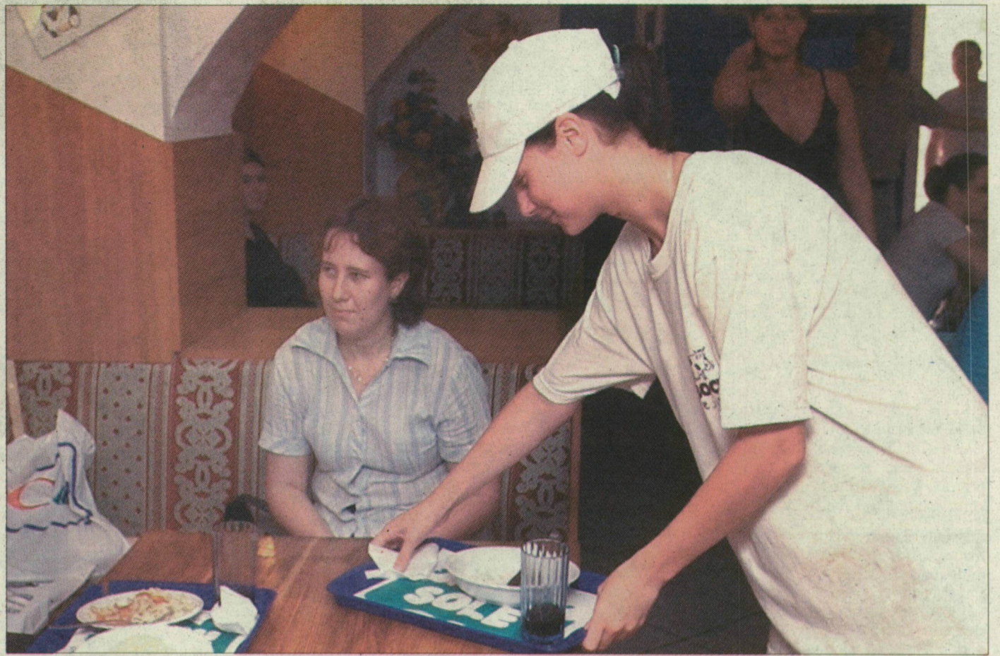
A szegedi Boci tejivóban is elkél a dolgos diákkéz