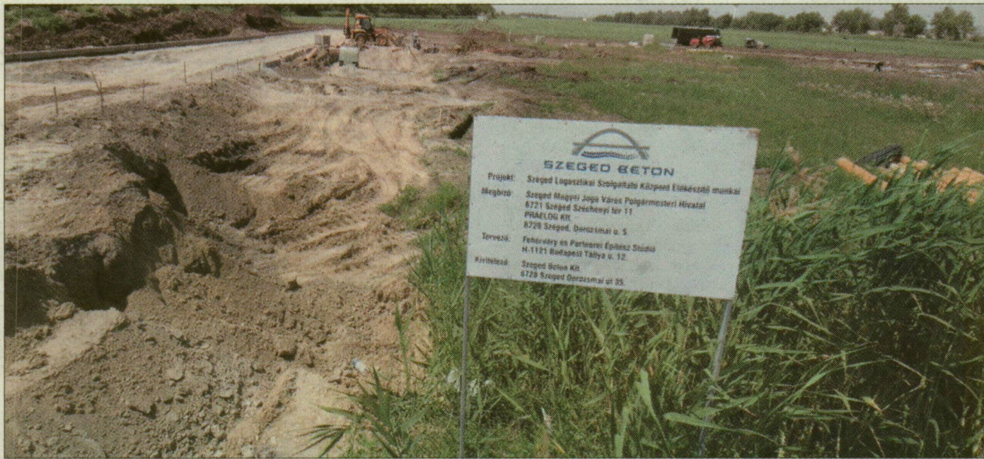
A logisztikai központ töredékén folyik csak az építkezés