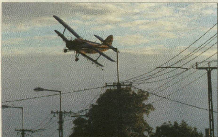
Főlszáll a repülő. Amikor egyszerre irtottak, nagyobb volt az eredmény

A két ember között az eljárás közben megromlott a kapcsolat, és ez a tárgyalóteremben is nyilvánvalóan kiderült. A két elítélt egyedül a kegelmi kérvényben bízhat. Az ilyenkor szokásos eljárás szerint körülbelül egy hónap múlva kell bevonulniuk a börtönbe.