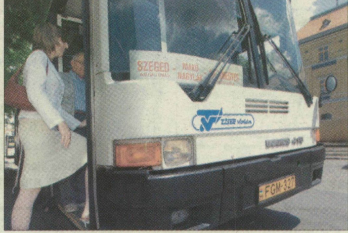
„Híd- és vonatpótló” autóbusz a szegedi nagyállomáson. Az IC-khez igazították a menetrendet