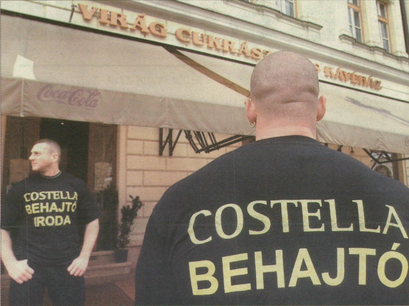
Pénzbehajtók a Virág cukrászda előtt. Végül üres kézzel távoztak