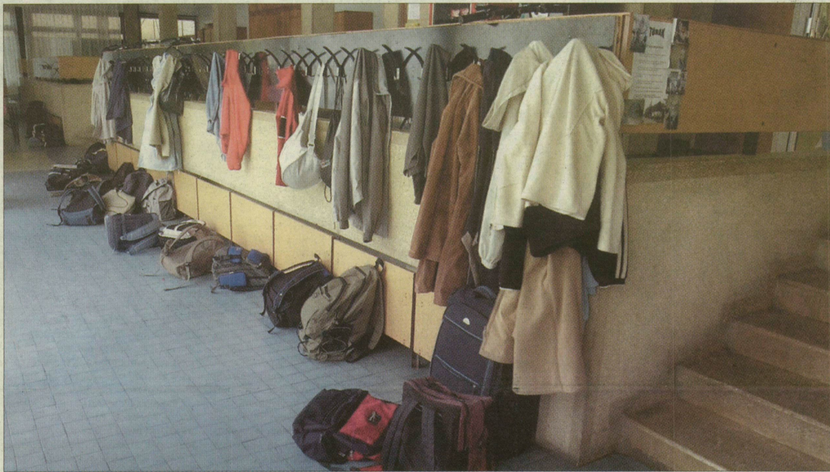
Az avatáson részt vevő, azt kiagyáló felsősöknek szedniük kellett a cökmökjüket, kizárták őket a diákszállásról

Folytatás az 5., jegyzetünk a 3. oldalon