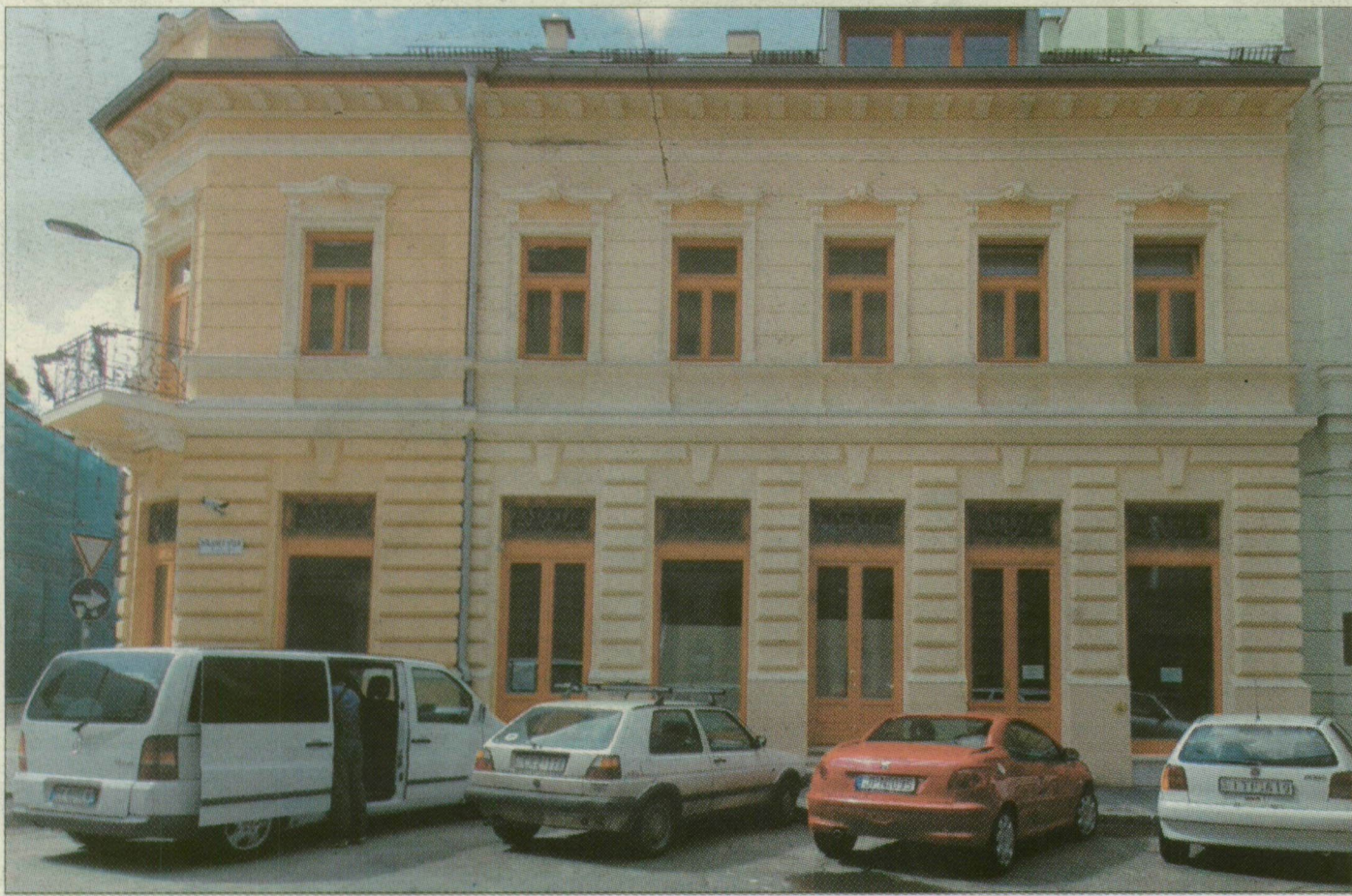
A megyés püspök az első emeleten kapott lakást, a ház Kölcsey utcára néző oldalán. Jobbról az első három ablak az övé.

Költözik az önkormányzattól kapott, frissen felújított Kelemen utcai bérlakásába Gyulay Endre megyés püspök. A 75 éves egyházi méltóság már elküldte felmondását a pápának, de még nem kapott választ a levelére.