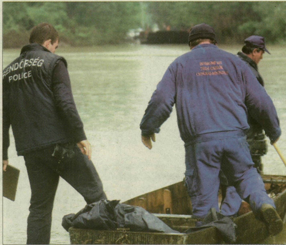
A baksi oldalra tolták, s kikötötték a mindszei komp

Elszakadt a mindszei komp kötele szombaton délután, szerencsére az utasok és a révész nem sérültek meg. A kisváros és Baks között közlekedő vízi jármű öt autót szállított. A révészek ledobták a vasmacsát, így kétszáz méter után megállt a sodrásban. Egyelőre nem tudják, mikor közlekedhet újra a vízi jármű: az áradás miatt vasárnap így is leálltak volna.