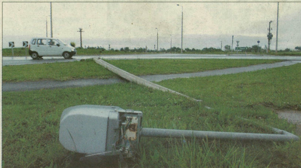
A szakember szerint az algyői körforgalom megfelel a magyar szabványnak