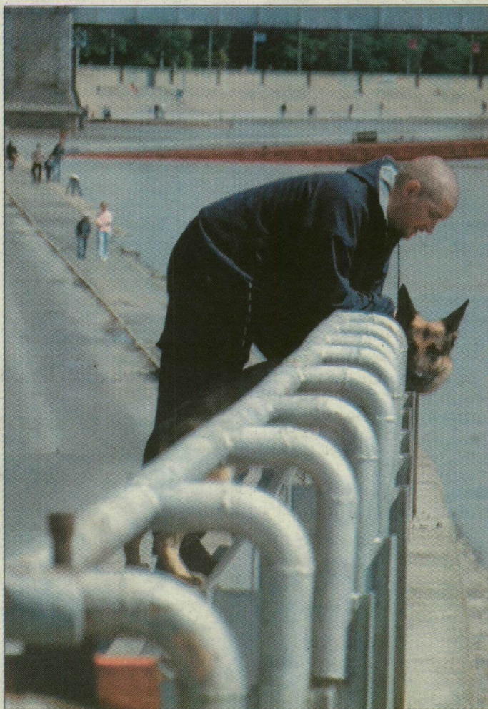
F. CS. Alig húzódott vissza, máris ismét árad a folyó

A következő napokban legfeljebb két-három milliméternyi csapadék hullhat, a délutáni órákban – helyi keletkezésű gomolyfelhőkből.